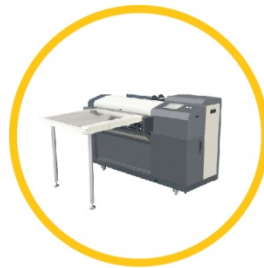
全自动手送高速叠图机