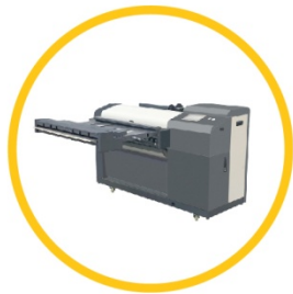
全自动联机高速叠图机