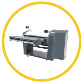
全自动联机中速叠图机