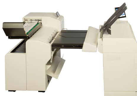
KIP 7570 打印系统 配置KIP 2300扫描仪和选配的KIPFold 2800在线全自动折图机