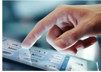
KIP多点触摸屏 KIP 70系列的所有系统功能均通过集成的12“多点触摸式彩色显示器执行，可复印，打印和扫描彩色和黑白文档。