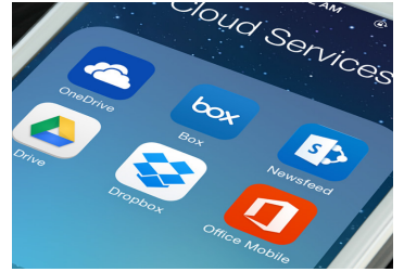
KIP云连接 通过流行的云服务共享在线内容已成为关键的协作工具。直接在多点触摸显示屏上云打印和扫描至云。