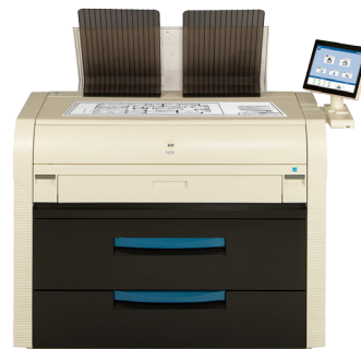
KIP 7570 多功能系统，集成了顶部堆图打印托盘

具有顶部堆图功能的KIP 7570网络打印生产系统可满足数字打印环境的严格工作流程需求。KIP智能多点触摸屏可使复杂的网络、云等打印资源的选择更简易，进行批量打印提交和管理更方便。