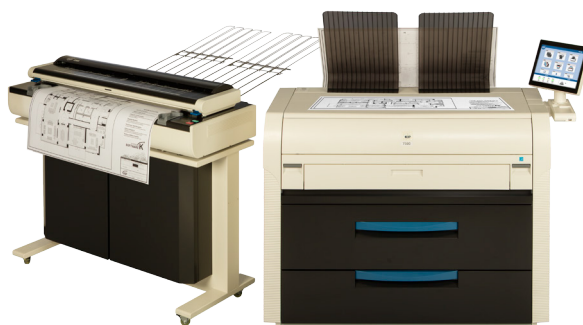
KIP 7570 多功能生产型系统，配有KIP 2300 CCD生产扫描仪

KIP 7570多功能生产型系统以最高质量完成打印工作和缩短交货时间。操作员使用KIP系统 K打印管理套件中的专业应用程序享受优异的预览和打印提交作业。KIP 2300 CCD扫描仪模块化机体设计，为彩色扫描速度，页面朝上/朝下/厚纸介质输送多样性和数字成像质量创造了全新的高标准。