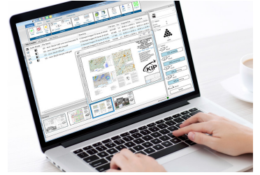
KIP打印提交 KIP PrintPro专为Windows®PC而设计，是一套直观的系统管理和打印提交应用程序，适用于全系列的黑白系统。