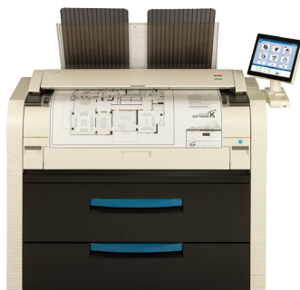
KIP 7570 多功能系统，集成了CIS扫描仪和顶部堆图打印托盘

具有CIS扫描技术的KIP 7570 多功能一体机集成系统顶部堆图设计概念适合在狭小的空间或靠墙摆放。通过功能强大的KIP智能多点触控屏增加复印，扫描和打印工作效率，实现直观的功能选择，便于操作。在屏幕预览以手缩放，旋转和平移以便编辑和打印所喜好的八点区。